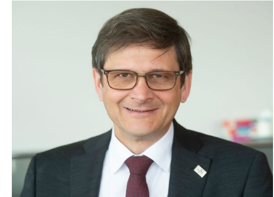
Dietmar Pistorius, Superintendent

„acht-geben“ – unter dieser Überschrift erhielten 2020/21 alle Gemeinden und Einrichtungen der Kirchenkreise An Sieg und Rhein und Bonn eine Arbeitshilfe zur methodischen und inhaltlichen Unterstützung bei der Erarbeitung des je eigenen Schutzkonzeptes gegen sexualisierte Gewalt. Eine wichtige Hilfe ist auch die landeskirchliche Handreichung „Schutzkonzepte praktisch 2021“.