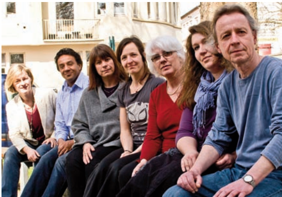
Das Team der allgemeinen Sozialberatung