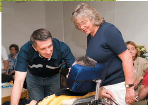
Als Leihoma mit Kindern spielen oder Menschen mit Handicap im Alltag unterstützen - die Möglichkeiten, sich zu engagieren sind vielfältig.

„Am besten nutzen wir uns selbst, wenn wir anderen Gutes tun“