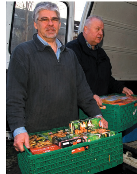
Lebensmittel ausfahren oder lieber ehrenamtliche Bürotätigkeit? In der Stellenbörse der Freiwilligen-Agentur finden Sie viele interessante Angebote.

Unsere Stellenbörse umfasst mehr als 100 Möglichkeiten, freiwillig aktiv zu werden, zum Beispiel Kinderbetreuung, Sorgentelefon, Mitarbeit in Kleiderkammern und Suppenküchen, Unterstützung von Flüchtlingen, Fahrdienste oder ehrenamtliche Bürotätigkeiten. Über alle Angebote informieren wir Sie gern in einem persönlichen Gespräch.