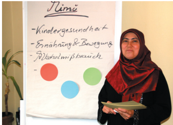
Projekt MiMi - Mit Migranten für Migranten: Freiwillige informieren ihre Landsleute über das deutsche Gesundheitswesen.