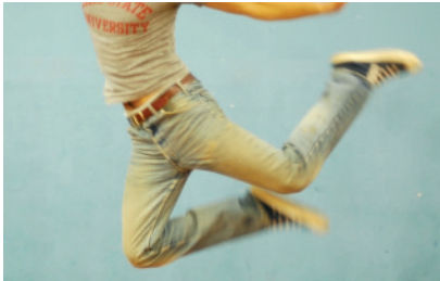
Paten für Ausbildung begleiten Jugendliche beim Sprung in den Beruf.

Die Initiative PfaU - Paten für Ausbildung - möchte Schülerinnen und Schülern Wege in die Berufswelt zeigen und sie auf der Suche nach einem Arbeitsplatz unterstützen. Berufserfahrene Begleiterinnen und Begleiter stehen jungen Menschen bei der Suche nach einem Praktikum oder einem Ausbildungsplatz mit Rat und Tat zur Seite.